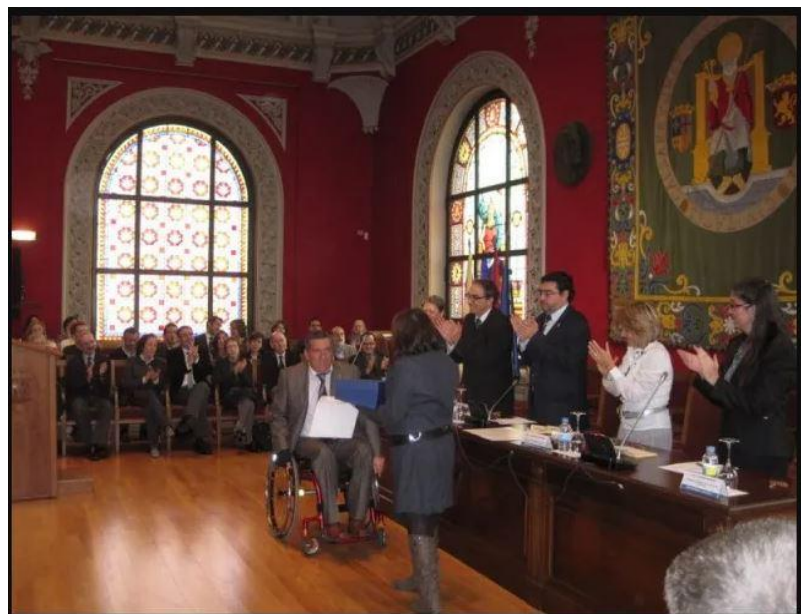
Premio facultad educación universidad de zaragoza 2011 3 edición