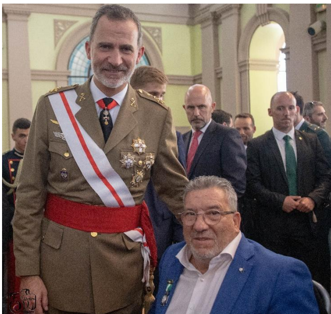
Medalla al mérito de la guardia civil con Distintivo blanco